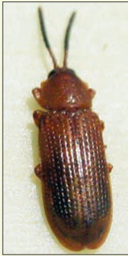
ಕೀಟಗಳ ಬಾಧೆಯಿಂದ ಒಣಗಿರುವ ತೆಂಗಿನ ಮರ (1), ಗಿಡ (2). ತೆಂಗಿನ ಮರ, ಗಿಡಗಳನ್ನು ಕಾಡುವ ವಿವಿಧ ಜಾತಿಯ ಕೀಟಗಳು (3,4,5).