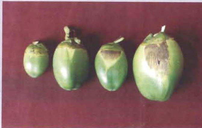
മണ്ഡരി ബാധിച്ച മച്ചിങ്ങകൾ