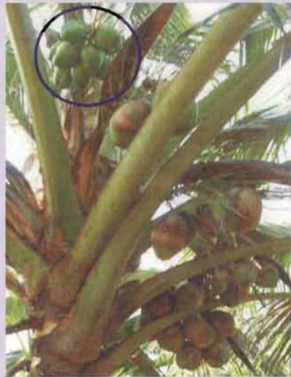
മരുന്നുതളിക്കു ശേഷം ഉണ്ടായിവരുന്ന ആരോഗ്യമുള്ള കുലകൾ

പ്രയോഗം ഈ മിത്രകീടങ്ങളുടെ എണ്ണം കുറയാനിടയാക്കുന്നു. അതിനാൽ മണ്ഡരിയെ നിയന്ത്രിക്കാൻ ജൈവീക നിയന്ത്രണരീതികളും, ശരിയായ കൃഷിരീതിയും വളപ്രയോഗങ്ങളും മറ്റും സ്വീകരിക്കുന്നതാണ് ഉത്തമം.