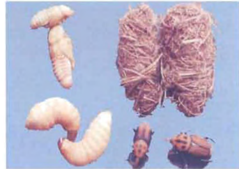
ಕೆಂಪು ಮೂತಿ ದುಂಬಿ

ಹೆಣ್ಣು ಜೀರುಂಡೆ ಕಾಂಡದ ಮೃದು ಭಾಗದಲ್ಲಿ ಸಣ್ಣ ರಂಧ್ರ ಕೊರೆದು ಮೊಟ್ಟೆ ಇಡುವುದು. ಇವುಗಳು ತಮ್ಮ ಜೀವನ ಕಾಲದಲ್ಲಿ ಅಂದಾಜು 175 ಮೊಟ್ಟೆ ಇಡುತ್ತವೆ. ಎರಡರಿಂದ ಮೂರು ದಿನಗಳು ಕಳೆದು, ಮೊಟ್ಟೆಯಿಂದ ಹೊರಬಂದ ಕಾಲಿಲ್ಲದ ಬಿಳಿ ಬಣ್ಣದ ಮರಿ ಹುಳುಗಳು ಮರದ ಮೃದು ಭಾಗ ಕೊರೆದು ತಿನ್ನುತ್ತ ಅಭಿವೃದ್ಧಿಗೊಳ್ಳುವುದರಿಂದ, ಮರದಿಂದ ಕೆಂಪು ಬಣ್ಣದ ನಾರು ಹೊರಸೂಸುತ್ತದೆ. ಹೊರಸೂಸಿದ ನಾರಿನಿಂದ ಮಾಡಲ್ಪಟ್ಟ ಕೋಶದೊಳಗೆ 12-20 ದಿವಸಗಳ ಕೋಶಾವಸ್ಥೆ ಕಳೆಯುತ್ತವೆ. ಈ ಕೀಟವು ತನ್ನ ಜೀವನ ಚಕ್ರ (ಮೊಟ್ಟೆಯಿಂದ ಪ್ರೌಢ ಕೀಟದ ಹಂತ)ವನ್ನು ನಾಲ್ಕು ತಿಂಗಳಲ್ಲಿ ಪೂರೈಸಿಕೊಳ್ಳುತ್ತದೆ.