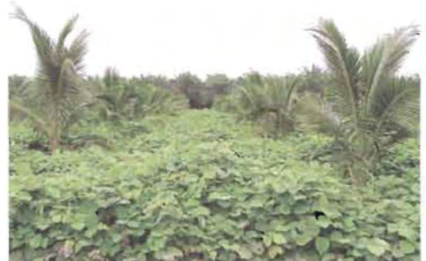
ಡ. ಮುಕುನಾ ಅಂಗಿಕ್ಯುಲೇಟಾ