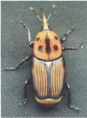
ಚಿತ್ರ 14. ಕೆಂಪು ಮೂತಿ ದುಂಬಿ

ಕೀಟವು ತೆಂಗಿನ ಮರದ ಮೃದುವಾದ ಅಂಗಾಂಶ, ಸುಳಿಭಾಗ ಹಾಗೂ ಹತ್ತಿರದ ಕಾಂಡಕ್ಕೆ ದಾಳಿಮಾಡುತ್ತದೆ. ಇದರ ದಾಳಿಯಿಂದಾಗಿ ಕಾಂಡದಲ್ಲಿ ರಂಧ್ರಗಳು ಕಾಣಿಸಿಕೊಂಡು ಅವುಗಳಿಂದ ಕಂದು ಬಣ್ಣದ ನಾರಿನಂತಹ ಪದಾರ್ಥ ಹೊರಸೂಸುತ್ತದೆ (ಚಿತ್ರ 14). ಮರಿ ಹುಳುಗಳು ಸುಳಿಭಾಗ ತಿನ್ನುವುದರಿಂದ ಮರ ಸಾಯುತ್ತದೆ. ತಿರಿಭಾಗದ ಎಲೆಗಳು ಒಣಗುತ್ತವೆ ಮತ್ತು ಸುಳಿಯು ಸೂರಗಿ ಅದರ ಬುಡ ಭಾಗ ಉದ್ದುದ್ದವಾಗಿ ಸೀಳಿಕೊಳ್ಳುವುದರ ಜೊತೆಗೆ