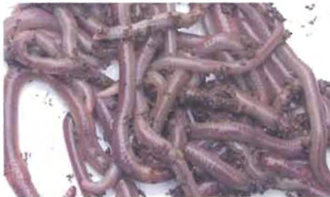
ಯುಡ್ರಿಲಿಸ್ ಸ್ಪಿ. ಎರೆಹುಳು