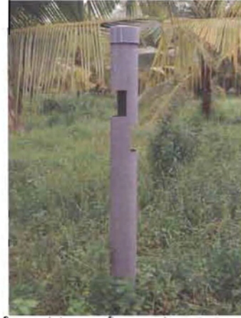
ಮೋಹಕ ನ್ಯಾನೋ ಮ್ಯಾಟ್ರಿಕ್ಸ್ ಬಲೆ