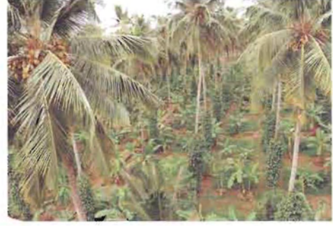
ಚಿತ್ರ 11. ತೆಂಗಿನ ತೋಟದಲ್ಲಿ ಹೆಚ್ಚು ಸಾಂದ್ರತೆಯ ಬೆಳೆ ಪದ್ಧತಿ