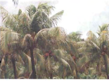
ಚಿತ್ರ 20. ಬೇರು (ಸೊರಗು) ರೋಗ ಬಾಧಿತ ಮರ