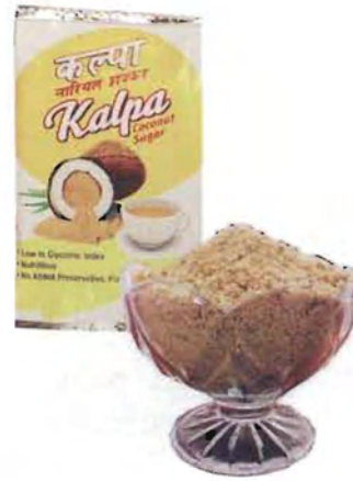
ಚಿತ್ರ 31. ತೆಂಗಿನ ಸಕ್ಕರೆಯ ಪೊಟ್ಟಣ

ಸಿ.ಪಿ.ಸಿ.ಆರ್.ಐ. ತಂತ್ರಜ್ಞಾನ ಮತ್ತು ಸಾಂಪ್ರದಾಯಿಕ ಪದ್ಧತಿಯಿಂದ ಪಡೆದ ಕಲ್ಪರಸದಲ್ಲಿ ಸ್ವಷ್ಟವಾದ ವ್ಯತ್ಯಾಸವನ್ನು ಕಾಣಬಹುದು. ಸಿ.ಪಿ.ಸಿ.ಆರ್, ಐ ತಂತ್ರಜ್ಞಾನದಿಂದ ಸಂಗ್ರಹಿಸಿದ ಕಲ್ಪರಸವು ಸ್ವಲ್ಪ ಕ್ಷಾರೀಯ ರಸಸಾರ ಹೊಂದಿದ್ದು,