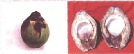
ಚಿತ್ರ 23. ಕಾಯಿ ಕೊಳೆ ಬಾಧಿತ ಮರ

ದ್ರಾವಣ ಅಥವಾ ಶೇ.0.1ರ ಕಾರ್ಬೆಂಡಾಜಿಮ್ ಎರಡು ಸಾರಿ 40 ದಿನಗಳ ಅಂತರದಲ್ಲಿ ಗೊನೆಯ ಮೇಲೆ ಸಿಂಪಡಿಸಿದರೆ ರೋಗವನ್ನು ನಿಯಂತ್ರಿಸಬಹುದು. ಉದುರಿದ ಚಿಕ್ಕ ಮತ್ತು ಇನ್ನೂ ಬಲಿಯದ ಕಾಯಿಗಳನ್ನು ಸಂಗ್ರಹಿಸಿ ಸುಟ್ಟು ಹಾಕಬೇಕು. ತೆಂಗು ಬೆಳೆಯಲ್ಲಿ ಸಾವಯವ ಕೃಷಿ ಪದ್ಧತಿಯನ್ನು ಅನುಸರಿಸಿದ್ದಲ್ಲಿ ಶೇ. 10 ಬೆಳ್ಳೊಳ್ಳಿ ಕಷಾಯವನ್ನು ಬಳಸಬೇಕು.