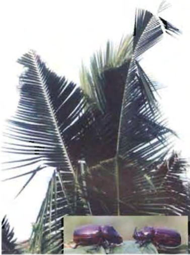
ಚಿತ್ರ 13. ಕುರುವಾಯಿ ದುಂಬಿ ಬಾಧಿತ ಮರ

ಒಟ್ಟು 39 ಜಾತಿಯ ಕಪ್ಪು ದುಂಬಿ ಕೀಟಗಳನ್ನು ಕಾಣಬಹುದು ಆದರೆ ಇದರಲ್ಲಿ ಕೆಲವು ಮಾತ್ರ ತೆಂಗಿನ ಬೆಳೆಗೆ ಬಾಧಿಸುತ್ತವೆ. ವರ್ಷ ಪೂರ್ತಿ ಈ ಕೀಟವಿರುವುದು, ಆದರೆ ಅದರ ತೀವ್ರತೆಯು ಜೂನ್ ನಿಂದ ಸಪ್ಟೆಂಬರ್ ವರೆಗೆ ಇರುತ್ತದೆ. ಈ ತಿಂಗಳುಗಳಲ್ಲಿ ಪ್ರೌಢ ಕೀಟವು ತೆಂಗಿನ ಸುಳಿಯನ್ನು ಪ್ರವೇಶಿಸುತ್ತದೆ.