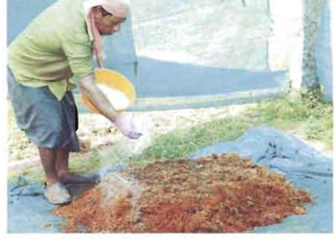
ಚಿತ್ರ 5. ತೆಂಗಿನ ನಾರಿನ ಕಾಂಪೋಸ್ಟ್

ನಾರಿನ ಹುಡಿಯು ನಾರು ಉದ್ದಿಮೆಯಲ್ಲಿ ಸುಲಭವಾಗಿ ದೊರೆಯುವ ಕಚ್ಚಾವಸ್ತು. ಇದು ಹೆಚ್ಚು ನೀರು ಹಿಡಿದಿಡುವ ಸಾಮರ್ಥ್ಯ ಹೊಂದಿದ್ದರೂ, ಕಚ್ಚಾ ರೂಪದ ನಾರಿನ ಹುಡಿಯು ಉತ್ತಮ ಗೊಬ್ಬರವಲ್ಲ. ಇದಕ್ಕೆ ಕಾರಣ ಇದರಲ್ಲಿರುವ ಹೆಚ್ಚಿನ ಪ್ರಮಾಣದ ಪಾಲಿಫಿನಾಲ್ ಅಂಶ ಮತ್ತು ಹೆಚ್ಚಿನ ಸಾರಜನಕ ಇಂಗಾಲದ ಅನುಪಾತ (108:1). ಸಿ.ಪಿ.ಸಿ.ಆರ್.ಐ.ನಲ್ಲಿ ಈ ದಿಸೆಯಲ್ಲಿ ಸಂಶೋಧನೆ ನಡೆಸಿ ಪರಿಹಾರ ಕಂಡುಕೊಳ್ಳಲಾಗಿದೆ. ನಾರಿನ ಹುಡಿಯನ್ನು