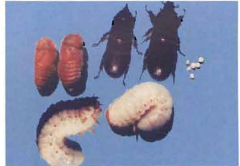
ಕುರುವಾಯಿ ದುಂಬಿ ಮರಿ ಹುಳು

ಈ ಕೀಟವು ಎಲ್ಲಾ ವಯಸ್ಸಿನ ಗಿಡಗಳಿಗೆ ಹಾನಿ ಮಾಡುತ್ತದೆ. ಇವುಗಳು ಎಲೆಗಳ ಸುಳಿಗಳ ಹಾಗೂ ಹೊಂಬಾಳೆಯ ಮೃದುವಾದ ಅಂಗಾಂಶಗಳನ್ನು ಕೊರೆದು ತಿಂದು, ನಾರಿನಂತಹ ಪದಾರ್ಥವನ್ನು ಹೊರಹಾಕುವುದರಿಂದ ಗಿಡದ ತುದಿ ಮೊಗ್ಗು, ಚಿಗುರಲೆಗಳು ತಿರುಚಿ, ವಿರೂಪಗೊಂಡು, ಗಿಡವು ಗಮನಾರ್ಹ ನಷ್ಟ ಹೊಂದುತ್ತದೆ (ಚಿತ್ರ 13). ಹಾನಿಗೀಡಾದ ಚಿಗುರಲೆಗಳು ಅರಳಿದ ಮೇಲೆ, ವಿಶಿಷ್ಟವಾದ 'V' ಆಕಾರದಲ್ಲಿ ಬೀಸಣಿಕೆಯಂತೆ ಕಾಣಿಸಿಕೊಳ್ಳುತ್ತವೆ. ಈ ಕೀಟ ಬಾಧೆಗೊಳಗಾದ ಗಿಡದ ಹೊಂಬಾಳೆಯಲ್ಲಿ ರಂಧ್ರ ಕಾಣಿಸಿಕೊಂಡು, ಪೂರ್ತಿಯಾಗಿ ಒಣಗಿ ಕಾಯಿಗಳು ನಾಶವಾಗುತ್ತವೆ. ಗಿಡದ