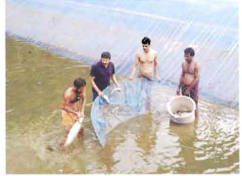
ಕ. ಮೀನು ಸಾಕಣೆ