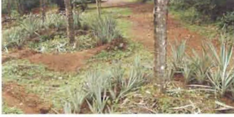
ಚಿತ್ರ 9. ಅರ್ಧ ಚಂದ್ರಾಕಾರದ ಬದು

ಅರ್ಧ ಚಂದ್ರಾಕಾರದ ಬದುವನ್ನು ತೆಂಗಿನ ಬುಡದಿಂದ 2 ಮೀ. ದೂರದಲ್ಲಿ ಇಳಿಜಾರು ಪ್ರದೇಶದಲ್ಲಿ ಒಂದು ಅಡಿ ಅಗಲದಷ್ಟು ನಿರ್ಮಿಸಬೇಕು (ಚಿತ್ರ 9).