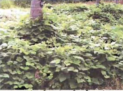
ಅ. ಪ್ಯೂರಿಯ ಫೆಸಿಲೋಯ್ಡ್