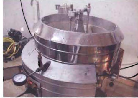
ಚಿತ್ರ 27 ಕೃಷಿ ತ್ಯಾಜ್ಯವನ್ನು ಇಂಧನವಾಗಿ ಉಪಯೋಗಿಸುವ ಯಂತ್ರ

ತಾಜಾ ಬಲಿತ ತೆಂಗಿನ ತಿರುಳಿನಿಂದ ಯಾಂತ್ರಿಕವಾಗಿ ಅಥವಾ ಸಹಜವಾಗಿ, ಶಾಖದ ಬಳಕೆಯಿಂದ ಅಥವಾ ಯಾವುದೇ ರಾಸಾಯನಿಕ ಸಂಸ್ಕರಣೆ ಇಲ್ಲದೇ, ಬ್ಲೀಚಿಂಗ್ ಉಪಯೋಗಿಸದೇ, ನೈಸರ್ಗಿಕ ಸುವಾಸನೆ ಮತ್ತು ಪೋಷಕಾಂಶಗಳನ್ನು ಕಾಪಾಡಿಕೊಂಡ ಎಣ್ಣೆಯೇ ವರ್ಜಿನ್ ತೆಂಗಿನ ಎಣ್ಣೆ. ಇದು ಮಧ್ಯಮ ಸರಣಿಯ ಕೊಬ್ಬಿನ ಅಥವಾ ಆವ್ಯವನ್ನು ಹೊಂದಿದ ಪ್ರಮುಖವಾಗಿ ಲಾರಿಕ್ ಆಸಿಡ್ ಮತ್ತು ಇದು ಖನಿಜಗಳು, ಜೀವಸತ್ವಗಳು, ಉತ್ಕರ್ಷಣ ನಿರೋಧಕಗಳ ನಿಧಿಯಾಗಿದ್ದು ಉತ್ತಮ ಪೌಷ್ಟಿಕ ಔಷಧಾಹಾರ