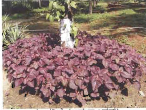
ಡ. ಹರಿವೆ (ಅಮರಾಂಥಸ್)