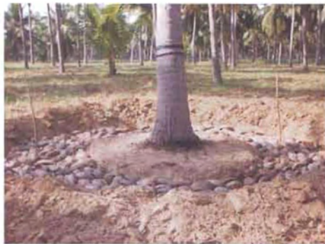
ತೆಂಗಿನ ಸಿಪ್ಪೆ ಚಿತ್ರ 6. ಹೊದಿಕೆ