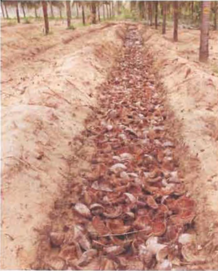
ಚಿತ್ರ 7. ಗುಂಡಿಯಲ್ಲಿ ತೆಂಗಿನ ಸಿಪ್ಪೆ ತುಂಬಿಸುವುದು

ತೆಂಗಿನ ಬುಡದಲ್ಲಿ ಕಾಂಪೋಸ್ಟ್ ಮಾಡಿದ ನಾರಿನ ಹುಡಿಯನ್ನು 10 ಸೆ.ಮೀ. ದಪ್ಪದ ಪದರದಲ್ಲಿ (50 ಕೆ.ಜಿ/ಮರಕ್ಕೆ) ಹಾಕುವುದು ಸಹ ಒಂದು ಪರಿಣಾಮಕಾರಿ ತಂತ್ರಜ್ಞಾನವಾಗಿದೆ. ಇದು ಮಣ್ಣಿನ ಭೌತಿಕ ಗುಣವನ್ನು ಸುಧಾರಿಸಿ, ತೇವಾಂಶ ಹಿಡಿದಿಟ್ಟುಕೊಳ್ಳುವ ಸಾಮರ್ಥ್ಯ ಹೆಚ್ಚಿಸುವುದರಿಂದ ತೆಂಗಿನ ಇಳುವರಿ ಸಹ ಹೆಚ್ಚಿಸುತ್ತದೆ. ಒಂದು ಸಾರಿ ಇದನ್ನು ಹಾಕಿದಾಗ ಸುಮಾರು 4-5 ವರ್ಷಗಳ ವರೆಗೆ ಬಾಳಿಕೆ ಬರುವುದು. ಸಂಪೂರ್ಣವಾಗಿ ಒಣಗಿದ ಕಳೆಯನ್ನು ಸಹ ಮುಚ್ಚಿಗೆ ಮಾಡಲು ಉಪಯೋಗಿಸಬಹುದು.