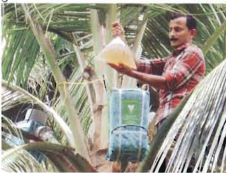
ಚಿತ್ರ 29. ಕೊಕೊ ಸ್ಟಾಪ್ ಚಿಲ್ಲರ್

ಕೊಕೊ ಸ್ಟಾಪ್ ಚಿಲ್ಲರ್ ಒಂದು ಪೊಳ್ಳಾದ ಪಿವಿಸಿ ಪೈಪ್, ಇದರ ಒಂದು ತುದಿಯು ಸಸ್ಯರಸವನ್ನು ಸಂಗ್ರಹಿಸಲು ಮಂಜುಗಡ್ಡೆ ತುಂಡುಗಳಿಂದ ಆವರಿಸಿದ 2 ಲೀ. ಸಾಮರ್ಥ್ಯದ ಕಂಟೇನರ್‌ನ್ನು ಇಡುವ ಪೆಟ್ಟಿಗೆಯಲ್ಲಿ ಸೇರುತ್ತದೆ ಮತ್ತು ಇನ್ನೊಂದು ತುದಿಯು ಕಂಟೇನರ್‌ನ್ನು ಸುಲಭವಾಗಿ ಇಡುವಂತೆ ಮತ್ತು ಹೊರತೆಗೆಯಲು ಸಾಧ್ಯವಾಗುವಂತೆ ಅಗಲವಾಗಿರುವ ದ್ವಾರವನ್ನು ಹೊಂದಿದ ಒಂದು ಪೊರ್ಟೆಬಲ್ ಸಾಧನ. ಈ ಪಿವಿಸಿ ಪೈಪ್‌ನ ಹೊರಗೋಡೆಗೆ (ಹೂಗೊಂಚಲು