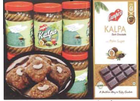
ಚಿತ್ರ 32. ಪಾನೀಯ ಚಾಕೋಲೇಟ್, ತಿನಸುಗಳು ಹಾಗೂ ಗಾಢ ಚಾಕೋಲೇಟ್

ತೆಂಗಿನ ಸಕ್ಕರೆಯಿಂದ ಇನ್ನೂ ಹಲವಾರು ಮೌಲ್ಯವರ್ಧಿತ ಉತ್ಪನ್ನಗಳನ್ನು ತಯಾರಿಸುವ