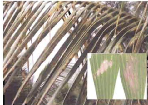
ಚಿತ್ರ 22. ಬೂದು ಎಲೆ ಚುಕ್ಕೆ ರೋಗ ಬಾಧಿತ ಎಲೆ