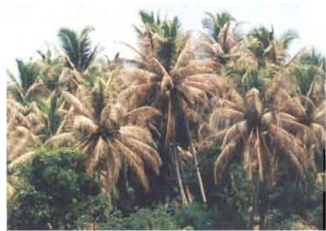
ಕಪ್ಪು ತಲೆ ಹುಳು ಬಾಧಿತ ಮರಗಳು

ಈ ಕೀಟವು 8-10 ವಾರಗಳ ಜೀವನ ಚಕ್ರ ಹೊಂದಿದೆ. ಮರಿ ಹುಳುಗಳ ಹಂತವು 42 ದಿನಗಳ ವರೆಗೆ ಇರುವುದು. ಬೆಳೆದ ಹುಳು ತಿಳಿ ಹಸಿರು ಬಣ್ಣ ಹೊಂದಿದ್ದು, ಕಂದು ಬಣ್ಣದ ಗೆರೆಗಳನ್ನು ಹೊಂದಿರುತ್ತದೆ. ಕಪ್ಪು ತಲೆಯ ಈ ಹುಳು ತನ್ನ ನೂಲಿನ ಗೂಡಿನಲ್ಲಿ ಕೋಶಾವಸ್ಥೆ ಕಳೆದು ಹೊರಬಂದ ಪತಂಗ ಬೂದು ಬಣ್ಣ ಹೊಂದಿರುತ್ತದೆ. ವಿಶೇಷವಾಗಿ