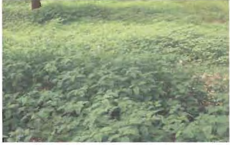
ಟ. ಮುಳ್ಳಿಲ್ಲದ ನಾಚಿಗೆಗಿಡ (ಮೈಮೊಸ ಇನ್‌ವೈಸಾ)

ಇನ್‌ವೈಸಾ) ಮತ್ತು ಕಲಪಗೊನಿಯಮ್ ಮ್ಯೂಕುನೋಯ್ಡ್ಸ್ (ಚಿತ್ರ 2) ತೆಂಗಿನ ತೋಟದಲ್ಲಿ ಉಪಯೋಗಿಸುವ ಉತ್ತಮ ಹೊದಿಕೆ ಬೆಳೆಗಳಾಗಿವೆ. ಇವುಗಳು ಸುಮಾರು 15-25 ಕೆ.ಜಿ. ಜೀವರಾಶಿಯನ್ನು ಹಾಗೂ 100-200 ಗ್ರಾಂ. ಸಾರಜನಕವನ್ನು 140-150 ದಿವಸಗಳಲ್ಲಿ ಉತ್ಪಾದಿಸುತ್ತವೆ.