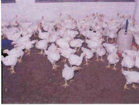
ಸ. ಕೋಳಿ ಸಾಕಣೆ