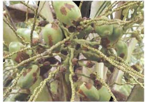
ನುಸಿ ಬಾಧಿತ ಗೊನೆ

4. 200 ಮಿ.ಲೀ. ತಾಳೆ ಎಣ್ಣೆ, 5ಗ್ರಾಂ ಗಂಧಕ ಮತ್ತು 12 ಗ್ರಾಂ ಸಾಬೂನು ಒಂದು