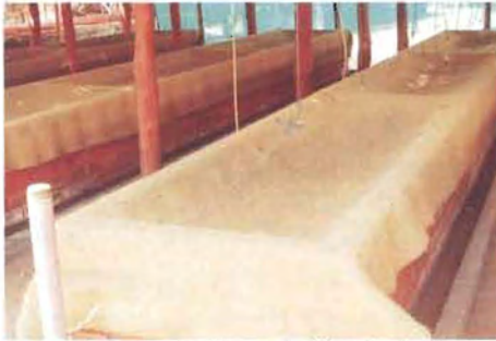
ಚಿತ್ರ ಅ. ಸಿಮೆಂಟ್ ತೊಟ್ಟಿಯಲ್ಲಿ

25 ರಷ್ಟು ರಂಜಕ ಹಾಗೂ 15 ರಷ್ಟು ಪೊಟ್ಯಾಷ್‌ನ್ನು ಒದಗಿಸಿದಂತಾಗುತ್ತದೆ. ಇದಲ್ಲದೇ ಪೋಷಕಾಂಶಗಳು ನಿಧಾನವಾಗಿ ತೆಂಗಿಗೆ ಲಭ್ಯವಾಗುವುದರ ಜೊತೆಗೆ ಮಣ್ಣಿನ ನೀರು ಹಿಡಿದಿಟ್ಟುಕೊಳ್ಳುವ ಸಾಮರ್ಥ್ಯವು ವೃದ್ಧಿಯಾಗುತ್ತದೆ. ಮರಳು ಮಿಶ್ರಿತ ಮಣ್ಣಿನಲ್ಲಿ ಶೇ.44ರಷ್ಟು ಅಧಿಕ ಇಳುವರಿಯನ್ನು ಶೇ.50 ರಷ್ಟು ಗ್ಲಿರಿಸೀಡಿಯಾ ಬೆಳೆಯುವುದರಿಂದ ಪಡೆಯಲಾಗಿದೆ.