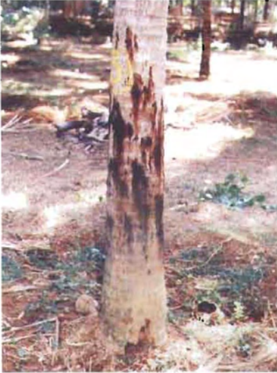
ಚಿತ್ರ 19. ತೆಂಗಿನ ಕಾಂಡ ಸೋರುವ ರೋಗ

ವೊದಲಿಗೆ ಕಾಂಡದ ಕೆಳಭಾಗದಲ್ಲಿ ತೊಗಟೆಯಿಂದ ದಟ್ಟ ಕೆಂಪು ಮಿಶ್ರಿತ ಕಂದು ಬಣ್ಣದ ದ್ರವವು ಹೊರ ಸೂಸುತ್ತದೆ. ಹತ್ತಿರದ ಈ ರೀತಿಯ ಒಂದೆರಡು ಮಜ್ಜೆಗಳು ಕೂಡಿಕೊಂಡು, ಅಗಲವಾದ ರಕ್ತ ಕಾರಿದ ಕಲೆಗಳು ಕಾಂಡದಲ್ಲಿ ಉಂಟಾಗುತ್ತವೆ (ಚಿತ್ರ 19). ಹೀಗೆ ಹೊರ ಸೂಸುವ ದ್ರವವು ಒಣಗಿ ಕಪ್ಪು ಬಣ್ಣಕ್ಕೆ ತಿರುಗುತ್ತದೆ. ಹೊರ ಭಾಗದ ತೊಗಟೆಯ ಒಳಗಿರುವ ಅಂಗಾಂಶಗಳು ದ್ರವ ಹೊರ ಸೂಸುವುದರಿಂದ ಸ್ವಾಭಾವಿಕವಾಗಿ ತನ್ನ ಬಣ್ಣವನ್ನು ಕಳೆದುಕೊಳ್ಳುತ್ತವೆ. ಈ