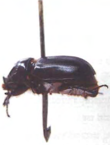
ಕಬ್ಬಿಣದ ಕೊಕ್ಕೆಯಿಂದ ದುಂಬಿಯನ್ನು ಹೊರಗೆಳೆಯುವುದು

ಪ್ರತಿ ಹೆಕ್ಟೇರ್‌ಗೆ ಒಂದರಂತೆ ಬಳಸಬೇಕು. ಚಿಕ್ಕ ವಯಸ್ಸಿನ ತೆಂಗಿನ ಮರವಿರುವ ತೋಟದಲ್ಲಿ ಇದರ ಉಪಯೋಗವನ್ನು ಮಾಡಬಾರದು.