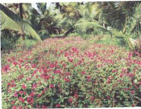
ಕ. ಗೋಂಪ್ಪಿನಾ ಹೂಗಳು