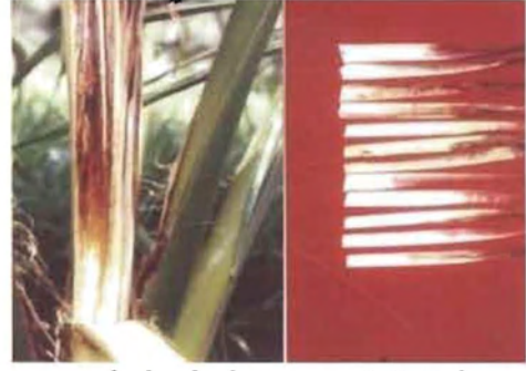
ಎಲೆ ಕೊಳೆ ರೋಗ ಬಾಧಿತ ಎಲೆ

ಕೆ.ಜಿ ಸಾವಯವ ಗೊಬ್ಬದರ ಜೊತೆಗೆ ಬೆರೆಸಿ ಮಿಶ್ರಣವನ್ನು ಪ್ರತಿ ಮರಕ್ಕೆ ಪ್ರತಿ ವರ್ಷ ಹಾಕಬೇಕು.