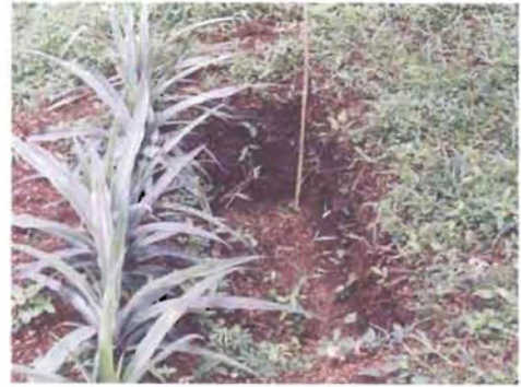
ಚಿತ್ರ 8. ಸಂಗ್ರಹ ಗುಂಡಿ

ತೆಂಗು ಬೆಳೆಯ ಮಧ್ಯದಲ್ಲಿ 1.5 x 0.5 x 0.5 ಮೀ. (ಉದ್ದ x ಅಗಲ x ಆಳ) ಇರುವ ಗುಂಡಿಗಳನ್ನು ತೋಡಬೇಕು. (ತೆಂಗಿನ ಅಂತರದಲ್ಲಿ 2 ಗುಂಡಿಗಳನ್ನು ತೋಡಬಹುದು) (ಚಿತ್ರ 8). ಈ ರೀತಿಯ ಗುಂಡಿಯ ಪಕ್ಕದಲ್ಲಿ ಅಂತರ ಬೆಳೆಗಳನ್ನು ಬೆಳೆಯಬಹುದು. ಈ ಗುಂಡಿಯಲ್ಲಿ ತೆಂಗಿನ ಸಿಪ್ಪೆಯನ್ನು ಸಹ ಹಾಕಬಹುದು.