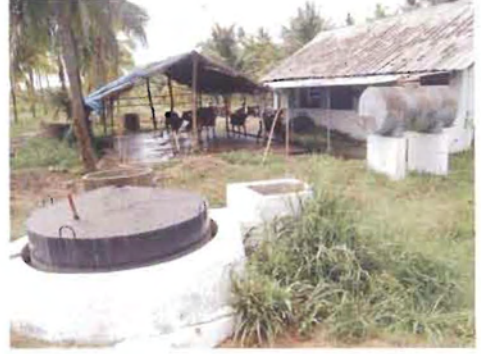
ಬ. ಜೈವಿಕ ಅನಿಲ+ಹಸು ಸಾಕಣೆ