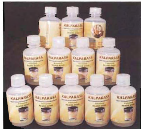
ಚಿತ್ರ 30. ಸಿ.ಪಿ.ಸಿ.ಆರ್.ಐ. ತಂತ್ರಜ್ಞಾನ