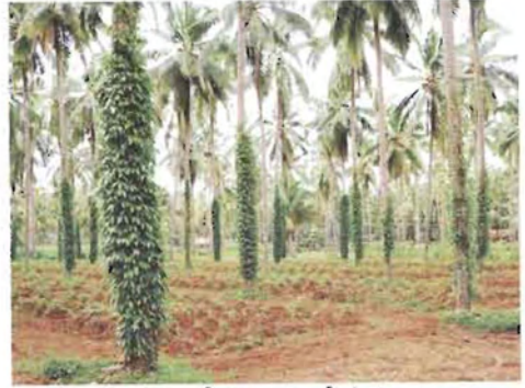
ಜ. ಲೋಂಗ್ ಪೆಪ್ಪರ್