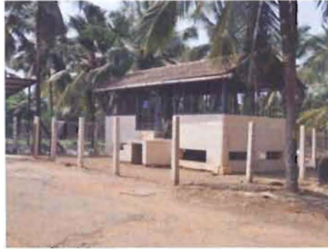
ಚ. ಮೇಕೆ ಸಾಕಣೆ