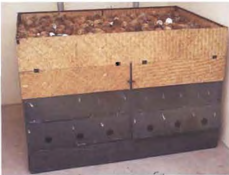
ಚಿತ್ರ 25. ಚಿಪ್ಪುಗಳನ್ನು ಇಂಧನವಾಗಿ ಬಳಸುವ ಕೊಬ್ಬರಿ ಡ್ರೈಯರ್