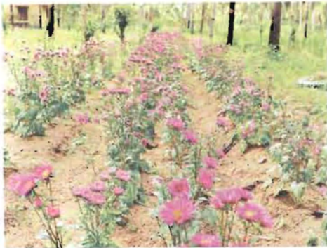
ವ. ಜೈನಾ ಆಸ್ಪರ್ ಹೂ