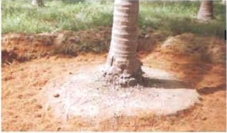
ತೆಂಗಿನ ನಾರಿನ ಹುಡಿ