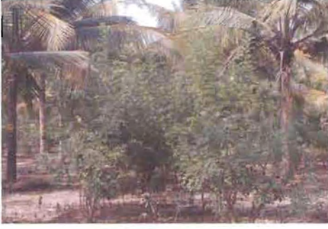
ಚಿತ್ರ 3. ಗ್ಲಿರಿಸೀಡಿಯ ಎಡೆ ಬೆಳೆ

25 ರಷ್ಟು ರಂಜಕ ಹಾಗೂ 15 ರಷ್ಟು ಪೊಟ್ಯಾಷ್‌ನ್ನು ಒದಗಿಸಿದಂತಾಗುತ್ತದೆ. ಇದಲ್ಲದೇ ಪೋಷಕಾಂಶಗಳು ನಿಧಾನವಾಗಿ ತೆಂಗಿಗೆ ಲಭ್ಯವಾಗುವುದರ ಜೊತೆಗೆ ಮಣ್ಣಿನ ನೀರು ಹಿಡಿದಿಟ್ಟುಕೊಳ್ಳುವ ಸಾಮರ್ಥ್ಯವು ವೃದ್ಧಿಯಾಗುತ್ತದೆ. ಮರಳು ಮಿಶ್ರಿತ ಮಣ್ಣಿನಲ್ಲಿ ಶೇ.44ರಷ್ಟು ಅಧಿಕ ಇಳುವರಿಯನ್ನು ಶೇ.50 ರಷ್ಟು ಗ್ಲಿರಿಸೀಡಿಯಾ ಬೆಳೆಯುವುದರಿಂದ ಪಡೆಯಲಾಗಿದೆ.