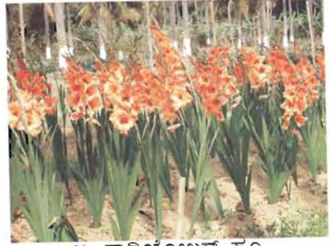
ಬ. ಗ್ಲಾಡಿಯೋಲಸ್ ಹೂ