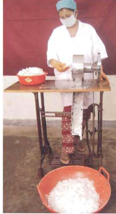
ಚಿತ್ರ 28. ತೆಂಗಿನ ಚಿಪ್ಸ್ ಯಂತ್ರ

ಗಮನಾರ್ಹ ಪ್ರಮಾಣದ ಕಾರ್ಬೋಹೈಡ್ರೇಟ್, ಸಸ್ಯ ಪ್ರೋಟಿನ್ ಮತ್ತು ನಾರಿನಾಂಶ ಲಭ್ಯವಿರುವ ತೆಂಗಿನ ತಿರುಳಿನಿಂದ ತೆಂಗಿನ ಚಿಪ್ಸ್ ತಯಾರಿಸಲಾಗುತ್ತದೆ. 100 ಗ್ರಾಂ ತೆಂಗಿನ ಚಿಪ್ಸ್, ಸುಮಾರು 1.5 ಪ್ರತಿಶತ ತೇವಾಂಶ, 45 ಪ್ರತಿಶತ ಕೊಬ್ಬು, 2 ಪ್ರತಿಶತ ಪ್ರೋಟಿನ್, 40 ಪ್ರತಿಶತ ಸಕ್ಕರೆ, 6.5 ಪ್ರತಿಶತ ನಾರಿನಾಂಶ, 1.5 ಪ್ರತಿಶತ ಬೂದಿ ಹೊಂದಿದ್ದು, ಸುಮಾರು 622 ಕ್ಯಾಲರಿ ಶಾಖವನ್ನು ಒದಗಿಸುತ್ತದೆ.