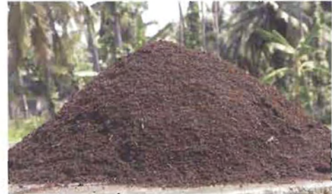
ಎರೆ ಹುಳು ಗೊಬ್ಬರ