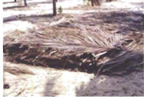
ತೆಂಗಿನ ತೋಟದ ಗುಂಡಿಯಲ್ಲಿ

ಇತ್ತೀಚಿನ ದಿನಗಳಲ್ಲಿ ಎರೆಹುಳುಗಳಿಂದ ತಯಾರಾದ ಎರೆಹುಳು ಗೊಬ್ಬರದ ಮಹತ್ವ ಎಲ್ಲರಿಗೂ ತಿಳಿದ ವಿಷಯ. ತೆಂಗಿನ ಎಲೆಗಳಲ್ಲಿ ಹೆಚ್ಚಿನ ಪ್ರಮಾಣದ ಲಿಗ್ನಿನ್ ಅಂಶ ಇರುವುದರಿಂದ ಅದು ಸ್ವಾಭಾವಿಕವಾಗಿ ಗೊಬ್ಬರವಾಗಲು ಅಧಿಕ ಸಮಯ ತೆಗೆದುಕೊಳ್ಳುತ್ತದೆ. ಎರೆಹುಳು ಜಾತಿಗೆ ಸೇರಿದ ಕೆಲವು ಪ್ರಭೇದಗಳು ತ್ಯಾಜ್ಯ ವಸ್ತುಗಳನ್ನು ಸೂಕ್ತವಾದ ಸಾವಯವ ಗೊಬ್ಬರವನ್ನಾಗಿ ಪರಿವರ್ತಿಸುತ್ತವೆ. ಸಿ.ಪಿ.ಸಿ.ಆರ್.ಐ. ಕಾಸರಗೋಡಿನಲ್ಲಿ ನಡೆಸಿದ ಸಂಶೋಧನೆಯಲ್ಲಿ ಎರೆಹುಳುವಿನ ಒಂದು ಪ್ರಭೇದವನ್ನು ಆಫ್ರಿಕನ್ ರಾತ್ರಿ ಸಂಚಾರಿ, ಯುಡ್ರಿಲಿಸ್ ಸ್ಪಿ. ( Eudrilus sp. ) ಎಂದು ಗುರುತಿಸಿ ಅದರ ಸಾಮರ್ಥ್ಯವನ್ನು ಪರೀಕ್ಷಿಸಲಾಗಿದೆ. ಇದರ ಪ್ರಕಾರ ಇದು ತೆಂಗಿನ ಎಲೆ ಮತ್ತು ಇತರೆ ತ್ಯಾಜ್ಯಗಳನ್ನು