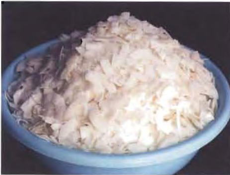
ಚಿತ್ರ 28 ಎ. ತೆಂಗಿನ ಚಿಪ್ಸ್

ಗರಿಗರಿಯಾದ ರುಚಿಕರವಾದ ಪೌಷ್ಟಿಕಾಂಶ ಭರಿತ ಚಿಪ್ಸ್‌ನ್ನು 8-9 ತಿಂಗಳ ತೆಂಗಿನ ಕಾಯಿಯ ತಿರುಳಿನಿಂದ ತಯಾರಿಸಲಾಗುತ್ತದೆ (ಚಿತ್ರ 28). ತೆಂಗಿನ ಕಾಯಿಯ ತಿರುಳನ್ನು 0.75 ಮಿ.ಮೀ. ಗಾತ್ರದ ಸಮನಾದ ತುಂಡುಗಳನ್ನಾಗಿಸಿ, ಉಪ್ಪು ನೀರು ಅಥವಾ ಸಕ್ಕರೆ ದ್ರಾವಣದಲ್ಲಿ ಆಸ್ಮೋಸಿಸ್ ಕ್ರಿಯೆಗೊಳಪಡಿಸಿ ತಯಾರಿಸಲ್ಪಡುವುದರಿಂದ, ಇತರೆ ಚಿಪ್ಸ್‌ಗಳಂತೆ ಎಣ್ಣೆಯಲ್ಲಿ ಕರಿಯುವ ಅಗತ್ಯವಿಲ್ಲ. ಇತ್ತೀಚಿನ ದಿನಗಳಲ್ಲಿ ಲಭ್ಯವಿರುವ ಸಂಸ್ಕರಿಸಿದ ತಿಂಡಿಗಳು ಕಡಿಮೆ ಪೌಷ್ಟಿಕಾಂಶ, ಅತಿ ಹೆಚ್ಚಿನ ಕಾರ್ಬೋಹೈಡ್ರೇಟ್ ಹಾಗೂ ಸಕ್ಕರೆ ಅಂಶ ಹೊಂದಿರುತ್ತದೆ. ಈ ತರಹದ ತಿಂಡಿಗಳನ್ನು ಹೆಚ್ಚಿಗೆ ಸೇವಿಸುವುದರಿಂದ ಹೃದಯದೊತ್ತಡ ಹೆಚ್ಚುವುದೆಂದು ಅಮೆರಿಕನ್ ಹಾರ್ಟ್ ಅಸೋಸಿಯೇಷನ್ ದೃಢಪಡಿಸಿದೆ. ಈ ನಿಟ್ಟಿನಲ್ಲಿ ತೆಂಗಿನ ಚಿಪ್ಸ್ ಒಂದು ಆರೋಗ್ಯ ವರ್ಧಕ ಪರ್ಯಾಯ ಲಘು ಆಹಾರವಾಗಿದೆ.