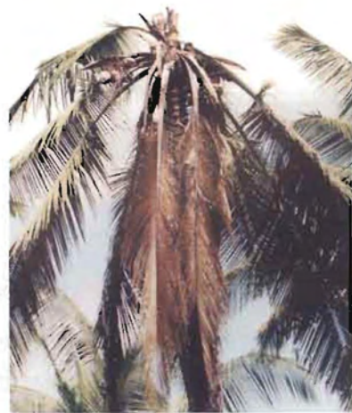
ಸುಳಿ ಕೊಳೆ ರೋಗದಿಂದ ಸತ್ತ ತೆಂಗಿನ ಮರ