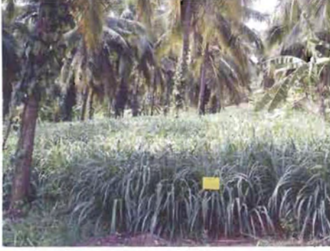
ಅ. ತೆಂಗು + ಕಾಳು ಮೆಣಸು + ಮೇವಿನ ಹುಲ್ಲು