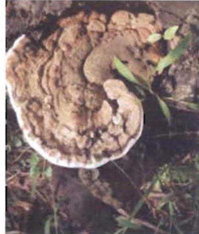
ಚಿತ್ರ 24. ಅಣಬೆ ರೋಗ ಬಾಧಿತ ಮರ