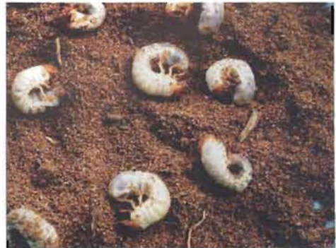
ಚಿತ್ರ 17. ತೆಂಗಿನ ಬೇರು ತಿನ್ನುವ ಹುಳು