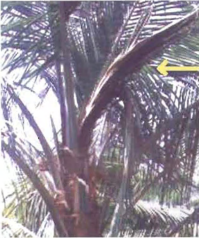
ಚಿತ್ರ 18. ಆರಂಭದ ಹಂತದಲ್ಲಿನ ಸುಳಿ ಕೊಳೆ ರೋಗ

ಸುಳಿಯು ಸೊರಗಿದಾಗಲೇ ರೋಗವನ್ನು ಗುರುತಿಸಿದ್ದೇ ಆದರೆ ರೋಗ ತಗುಲಿದ ಭಾಗವನ್ನು ಸಂಪೂರ್ಣವಾಗಿ ತೆಗೆದು ಹಾಕಿ, ಸ್ವಚ್ಛಗೊಳಿಸಿ ಬೋರ್ಡೋಪೇಸ್ಟನ್ನು ಬಳಿಯಬೇಕು. ಆ ಬಳಿಕ ಈ ಭಾಗವನ್ನು ಮುಚ್ಚಿಟ್ಟು ಮಳೆಗಾಲದಲ್ಲಿ ಈ ಪೇಸ್ಟ್ ತೊಳೆದು ಹೋಗದಂತೆ ರಕ್ಷಿಸಬೇಕು. ತೀವ್ರ ಸ್ವರೂಪದ ರೋಗ ತಗುಲಿದ ಗಿಡಗಳನ್ನು ಕಡಿದು ಸುಡಬೇಕು. ಉಳಿದ ಗಿಡಗಳಿಗೆ ಈ ರೋಗವು ಹರಡದಂತೆ ಪೂರ್ವ ಯೋಜಿತ ನಿಯಂತ್ರಣಕ್ಕಾಗಿ ಶೇ. 1 ರ ಬೋರ್ಡೋದ್ರಾವಣವನ್ನು ಸಿಂಪಡಿಸಬೇಕು