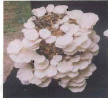
ಚಿತ್ರ 33. ತೆಂಗಿನ ತ್ಯಾಜ್ಯ ವಸ್ತುಗಳಿಂದ ಅಣಬೆ ಕೃಷಿ

ಬೆಳೆ ನಿರ್ವಹಣೆ ಬೀಜಾಣುಗಳನ್ನು ಸೇರಿಸಿದ ಚೀಲವನ್ನು ಅಣಬೆ ಬೆಳೆಸುವ ಕೋಣೆಯಲ್ಲಿಡಬೇಕು. ಕಡಿಮೆ ವೆಚ್ಚದ ಅಣಬೆ ಬೆಳೆಸುವ ಕೊಠಡಿಯನ್ನು ತೆಂಗಿನ ಕಾಂಡ ಮತ್ತು ಹಣೆದ ಎಲೆಗಳನ್ನು ಉಪಯೋಗಿಸಿ ತೆಂಗಿನ ತೋಟದಲ್ಲೇ ಕಟ್ಟಬಹುದು. ತೆಂಗಿನ ತುಂಡುಗಳಿಂದಲೇ ಕೊಠಡಿಯೊಳಗೆ ಅಟ್ಟಳಿಗೆಗಳನ್ನು ಹಾಕಿ ಚೀಲಗಳನ್ನು ಇರಿಸಬಹುದು. ಅಟ್ಟಳಿಗೆಯ ಮೇಲೆ ನದಿ ತೀರದ ಮರಳನ್ನು ಹರಡಬೇಕು. ಅಟ್ಟಳಿಗೆಯ ಬದಿಗಳಿಗೆ ಗೋಣಿ ಚೀಲಗಳನ್ನು