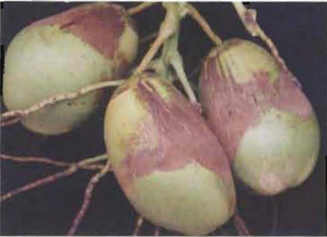
ಚಿತ್ರ 16. ನುಸಿ ಬಾಧಿತ ತೆಂಗಿನ ಕಾಯಿ

ನುಸಿ ಕೀಟದ ಜೀವನ ಚಕ್ರವು 7-10 ದಿನಗಳಲ್ಲಿ ಪೂರ್ತಿಯಾಗುವುದು. ನೀಳವಾದ ಬಿಳಿ ಬಣ್ಣದ ಈ ಕೀಟವು ಸೂಕ್ಷ್ಮದರ್ಶಕದ ಮೂಲಕ ಮಾತ್ರ ನಮ್ಮ ಕಣ್ಣಿಗೆ ಕಾಣಿಸುತ್ತದೆ. ಹೆಣ್ಣು ನುಸಿ ಕೀಟ 200-250 ಮೈಕ್ರಾನ್ ಉದ್ದ ಮತ್ತು 36-52 ಮೈಕ್ರಾನ್ ಅಗಲವಿದೆ. ಈ ಕೀಟದ ತಲೆ ಭಾಗದಲ್ಲಿ ಸೂಜಿ ಮೊನೆಯಾಕಾರದ ಬಾಯಿ ಮತ್ತು ಹೊಟ್ಟೆಯ ಭಾಗದಲ್ಲಿ ಎರಡು ಜೋಡಿ ಕಾಲುಗಳಿವೆ. ಇದರ ಮೇಲ್ಮೈಯಲ್ಲಿ ಸಾಲಾಗಿರುವ ಹರಿತ ರೋಮಗಳಿವೆ. ಹೆಣ್ಣು ನುಸಿ ಕೀಟವು ತನ್ನ ಜೀವನ ಕಾಲದಲ್ಲಿ 100-150 ಮೊಟ್ಟೆಯಿಡುತ್ತದೆ. ಈ ನುಸಿಯ ವಿವಿಧ ಜೀವನ ಹಂತಗಳನ್ನು ಹೂವಿನ ದಳಗಳು ಮತ್ತು ಕೋಮಲ ಭಾಗಗಳಲ್ಲಿ ಕಾಣಬಹುದು. ಈ ಕೀಟವು ಗಾಳಿಯ ಮುಖಾಂತರ ಹರಡುತ್ತದೆ. ಈ ಕೀಟವು ಇಡೀ ವರ್ಷ ಹಾನಿಮಾಡಿದರೂ, ಬೇಸಿಗೆ ಕಾಲದಲ್ಲಿ ಅಧಿಕ ಸಂಖ್ಯೆಯಲ್ಲಿ ಕಾಣಬರುತ್ತದೆ.