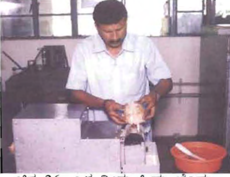
ಚಿತ್ರ 26. ಎಳ ನೀರು ಹಿಮ ಚೆಂಡು ಯಂತ್ರ

ಕಷ್ಟಾಗಿರಬಾರದು. ಮೊದಲಿಗೆ ಎಚ್ಚರದಿಂದ ಯಂತ್ರದ ಮೂಲಕ ಗರಟೆಯನ್ನು ಸುತ್ತಲೂ ಕತ್ತರಿಸಿಕೊಳ್ಳಬೇಕು. ನೈಲಾನಿನ ಬಾಗುವ ಚೂರಿಯಂತಹ ಉಪಕರಣ ತೂರಿ ಕೆಳಗಿನ ಚಿಪ್ಪನ್ನು ಪ್ರತ್ಯೇಕಿಸುವುದು ಮುಂದಿನ ಘಟ್ಟ ಅನಂತರ ಮೇಲಿನ ಚಿಪ್ಪು ಬಿಳಿ ಚೆಂಡಿನ ಸುತ್ತಲೂ ಇರುವ ಕಂದು ಪದರಗಳನ್ನು ಲಘುವಾಗಿ ಕಿತ್ತಿ ಬಿಟ್ಟರೆ ಮುಗಿಯಿತು. ಎಳನೀರು ಸುಲಿದು ಹಿಮಚೆಂಡಾಗಿ ರೂಪ ಪಡೆಯಿತು. ಚಿಪ್ಪಿನಲ್ಲಿ ರಂಧ್ರ ಮಾಡುವಾಗ ಎಷ್ಟು ಆಳಬೇಕೆಂಬುದನ್ನು ಅನುಸರಿಸಬಹುದಾಗಿದೆ. ಈ ಯಂತ್ರವನ್ನು ಬಳಸಿ ಅವಿದ್ಯಾವಂತರೂ ಸಹ 5 ನಿಮಿಷದಲ್ಲಿ ಒಂದು ಸ್ನೋಬಾಲ್ ಎಳನೀರನ್ನು ತಯಾರಿಸಬಹುದು. ಅನುಭವವಾದ ಮೇಲೆ ಕೇವಲ 3 ನಿಮಿಷ ಇದಕ್ಕೆ ಸಾಕಾಗುತ್ತದೆ.