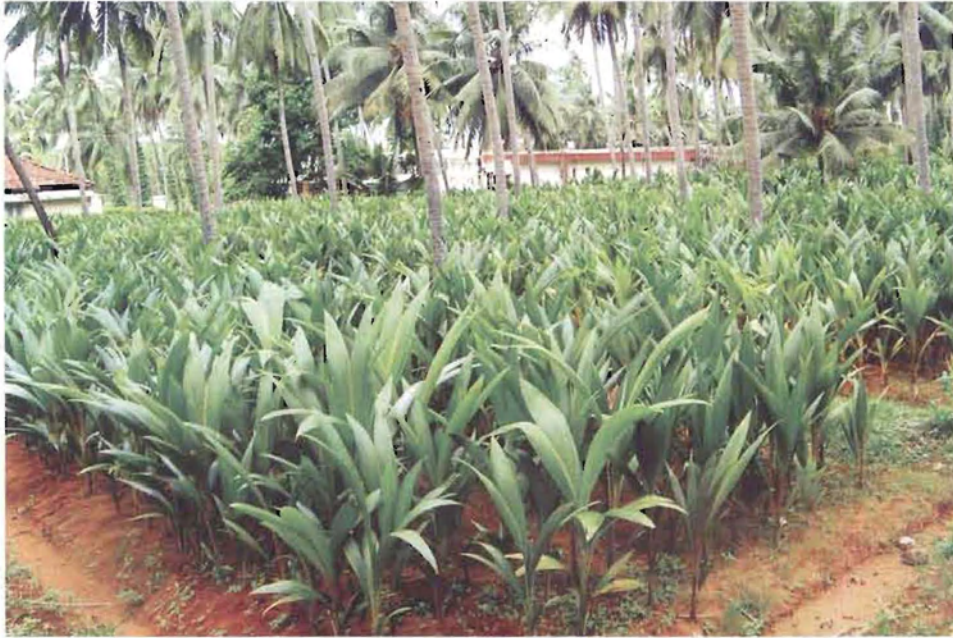
ಚಿತ್ರ 1. ಉತ್ತಮ ಗುಣಮಟ್ಟದ ಸಸಿಗಳು

ಯಾವುದೇ ತೆಂಗಿನ ತೋಟದಲ್ಲಿ ಉತ್ತಮವಾದ ಇಳುವರಿ ಪಡೆಯುವಲ್ಲಿ, ಸಸಿ ಮಡಿಯಲ್ಲಿನ ಉತ್ತಮವಾದ ಸಸಿಯ ಆಯ್ಕೆ ಪ್ರಮುಖ ಪಾತ್ರ ವಹಿಸುತ್ತದೆ. ಎತ್ತರದ ತಳಿಗಳಿದ್ದಲ್ಲಿ, ಒಂದು ವರ್ಷದ, 5-6 ಎಲೆಗಳನ್ನು ಹೊಂದಿದ, ಬುಡದ ಸುತ್ತಳತೆ 10 ಸೆಂ.ಮೀ. ನಷ್ಟು ಇರುವ ಹಾಗೂ ಶೀಘ್ರವಾಗಿ ಎಲೆಗಳು ಸೀಳಿರುವ ಸಸಿಗಳನ್ನು ಆಯ್ಕೆ ಮಾಡಬೇಕು (ಚಿತ್ರ 1). ಗಿಡ್ಡ ತಳಿಗಳಲ್ಲಿ, ಬುಡದ ಸುತ್ತಳತೆ 8 ಸೆಂ.ಮೀ. ನಷ್ಟಿರುವ ಹಾಗೂ 80 ಸೆಂ.ಮೀ ಎತ್ತರವಿರುವ ಸಸಿಗಳನ್ನು ಆಯ್ಕೆ ಮಾಡಬೇಕು. ನೀರು ಹಿಡಿದಿಟ್ಟುಕೊಳ್ಳುವ ತಗ್ಗು ಪ್ರದೇಶಗಳಿಗಾಗಿ 1½-2 ವರ್ಷದ ಸಸಿಗಳನ್ನು ಆಯ್ಕೆಮಾಡಬೇಕು.